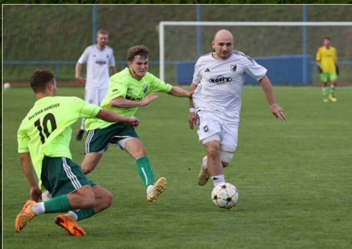
Fotbalisté Kostelce nad Orlicí na domácím hřišti přestřelili Kunčice 5:4.