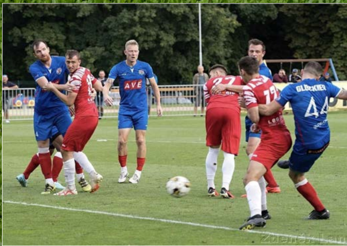
Ve FORTUNA Divizi C mužů prohrála hradecká Slavia na hřišti Benátek n. J. 2:0.