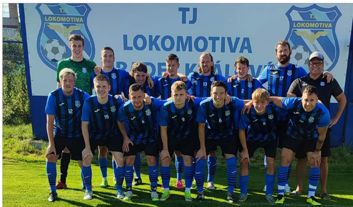
Fotbalisté Lokomotivy Hradec Králové, účastníci 1. B třídy.