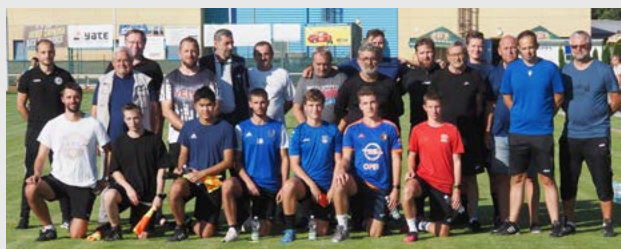
Společný snímek ze semináře rozhodčích OFS Hradec Králové.