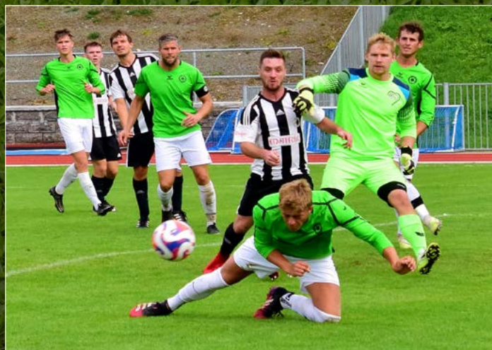
Rychnov v KP doma přesvědčivě zdolal Lázně Bělohrad 3:0.