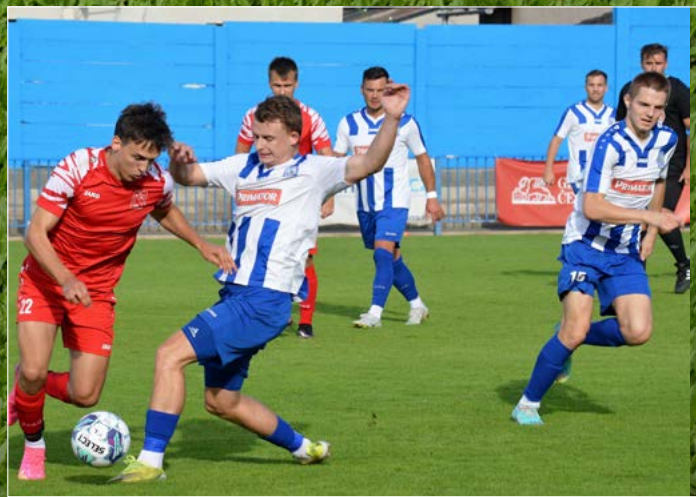
V krajském přeboru přetlačil Náchod v závěru Jaroměř 2:1.