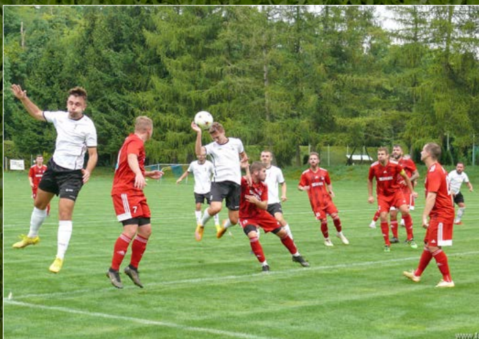
V nejvyšší krajské lize si Solnice na hřišti ve Vamberku poradila s Libčany 4:2.