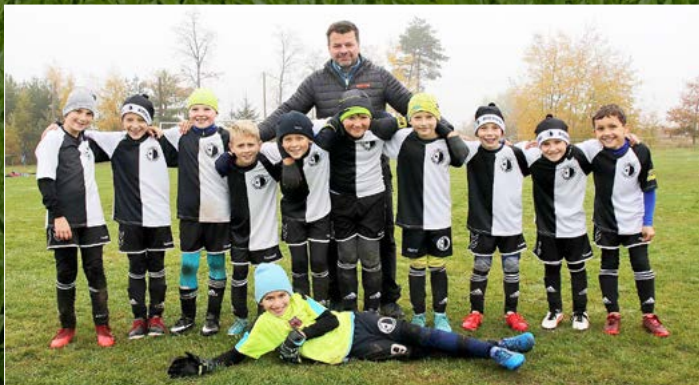
Rychnov (bílá).