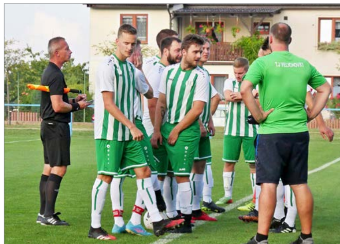
TJ Velichovky v Poháru hejtmana doma vyzvaly Jaroměř.

V dnešní době by bylo asi nemožné dosáhnout takového sportovního úspěchu, jako byl postup po 36 letech do 1. B třídy.