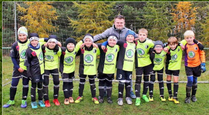
Rychnov (žlutá).