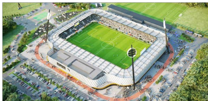
Budoucí fotbalový stadion v Hradci Králové.