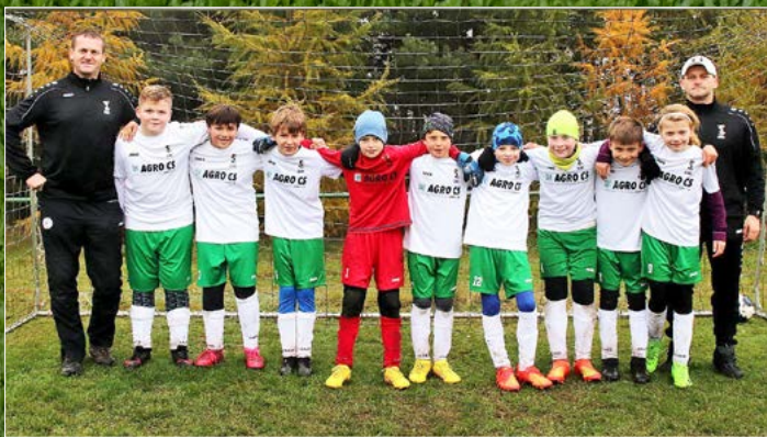
Tým Solnice.