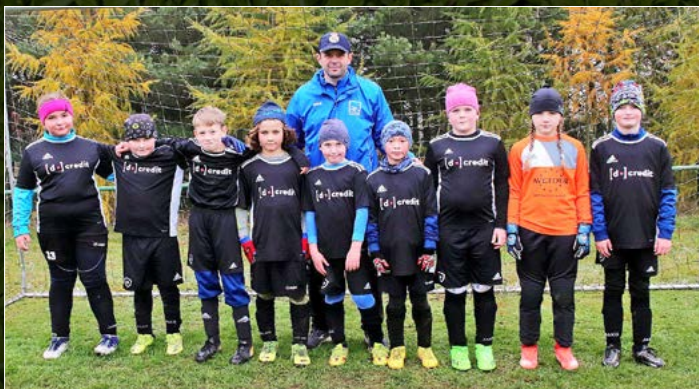
Dobruška (černá).