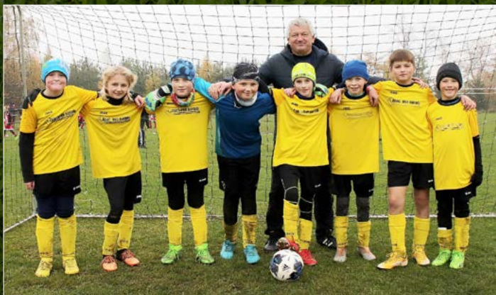
Dobruška (oranžová).