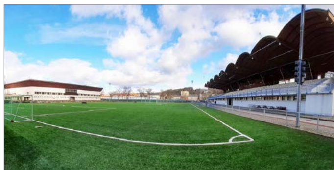
Fotbalový stadion v Trutnově.