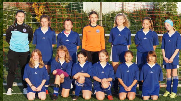
Výběr OFS Náchod dívky WU-13.

Na UMT v areálu FC Slavia Hradec Králové se střetly okresní výběry dívek WU-13 ročníku narození 2010 a mladších.