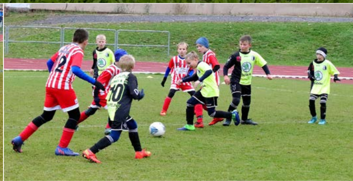
Jeden z turnajů DRANA KP starších přípravků U11 sk. B na hřišti Náchoda.

Na UMT v areálu FC Slavia Hradec Králové se střetly okresní výběry dívek WU-13 ročníku narození 2010 a mladších.