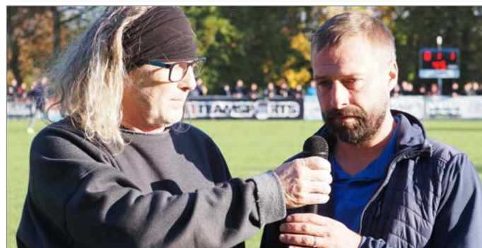
Kraus v rámci MOL Cupu Chlumec n. C. – FC Hradec Králové.