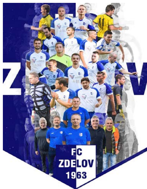
Současný tým mužů Zdelova.