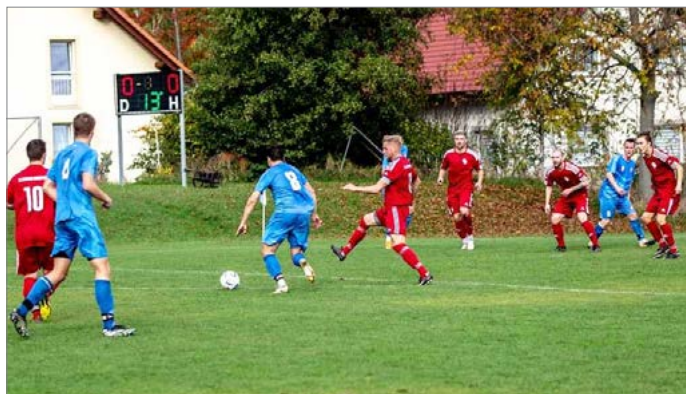
Míka (modrý dres číslo osm) je v Železnici spokojený s partou hráčů v kabině.

Vztah mám k Jičínu pozitivní, fotbalově mě toho naučili opravdu hodně. Vždy, když se s bývalými spoluhráči potkám, tak je to ryze přátelské a navzájem si popřejeme, ať se daří.