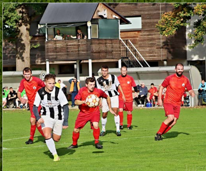
Derby utkání AM GnoI 1. A třídy Lázně Bělohrad – Miletín (3:0).