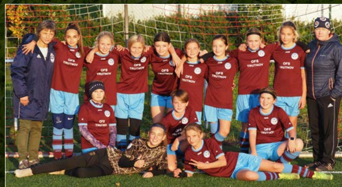
Výběr OFS Trutnov dívky WU-13.