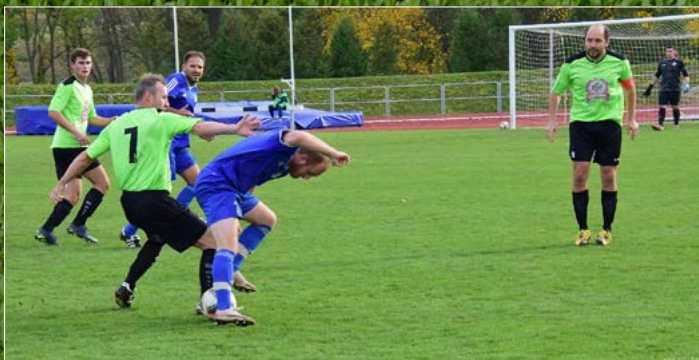
Dobruška B – Častolovice v Okresním přeboru II. třídy na Rychnovsku.