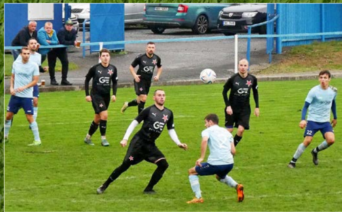
V M GROUP CZ Krajském přeboru vyhrála Slavia Hradec Králové na hřišti Jaroměře jasně 6:0.