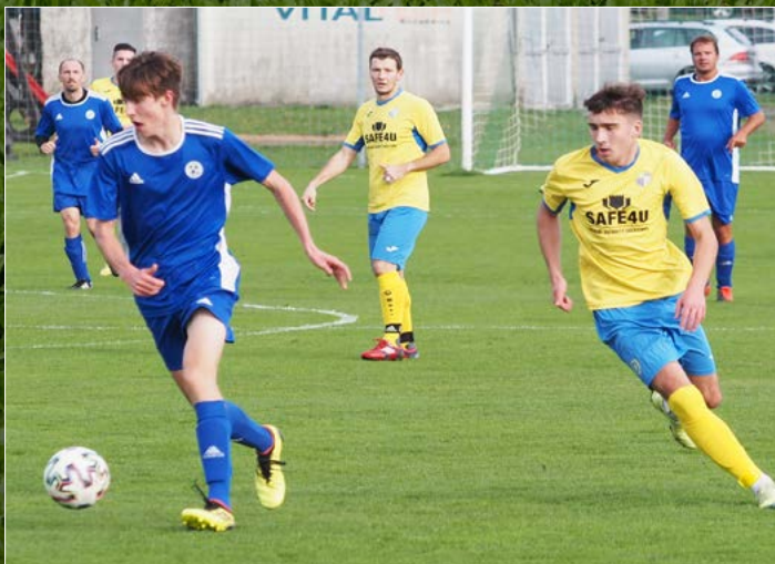
DAHASL OP OFS HK Dohalice – Roudnice B.