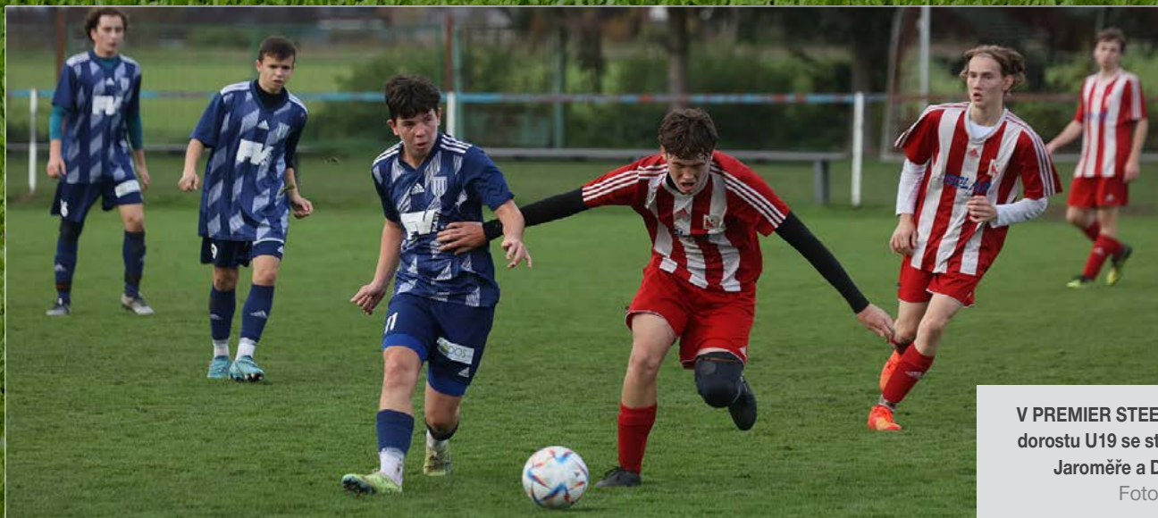
V PREMIER STEEL KP staršího dorostu U19 se střetla mužstva Jaroměře a Dvora Králové.