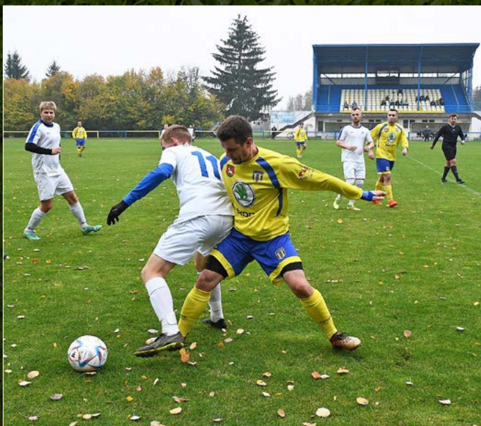
V JAKO 1. B třídě sk. B zdolali fotbalisté Opočna Vamberk na jeho hřišti jasně 5:1.