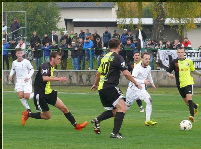
Interesantní duel dvou mužstev z popředí tabulky byl k vidění v Solnici, kde domácí lídr M GROUP CZ Krajského přeboru vyzval Rychnov n. Kn. Z výhry 2:1 se radovali domácí.