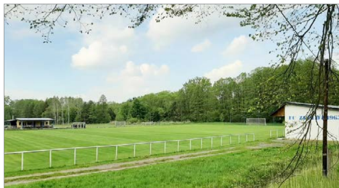
Stadion ve Zdelově.