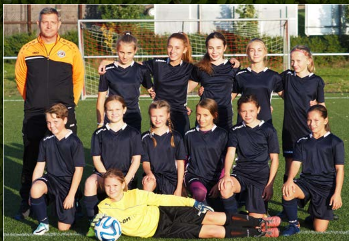
Výběr OFS Hradec Králové dívky WU-13.