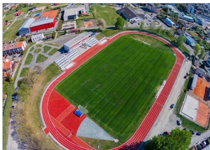
Fotbalový stadion v Rychnově nad Kněžnou.