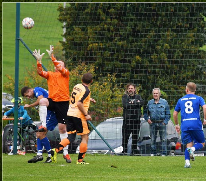
V JAKO 1. B třídě skupiny B se střetla Javornice s Opočnem. Z výhry 2:1 se nakonec radovali domácí.