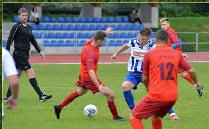
Náchod B v AM GnoI 1. A třídě nestačil na Miletín a svému soupeři podlehl 1:3.