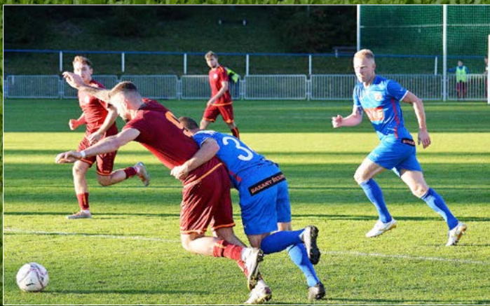
Fotbalisté Náchoda v Divizi C prohráli na hřišti Benátek nad Jizerou 2:0.