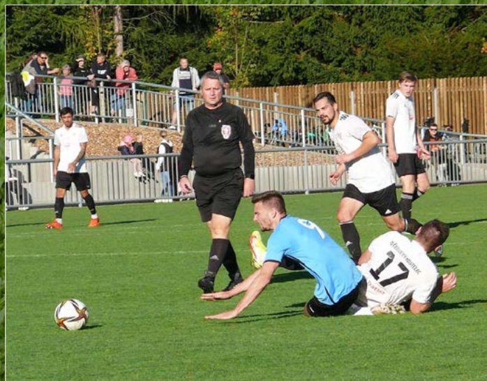
V M GROUP CZ krajském přeboru vyzval Červený Kostelec na domácí půdě Solnici. Utkání nakonec skončilo remízou 1:1.