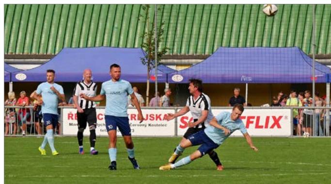
Jaroměř zahájila letošní sezonu v Červeném Kostelci.