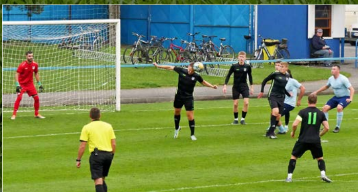
Jaromeř v M GROUP CZ krajském přeboru na domácí půdě zdolala Týniště nad Orlicí 2:1.