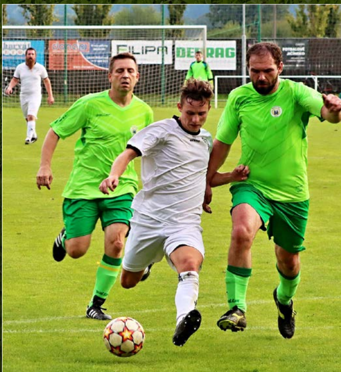
V Maso Sedlák Okresním přeboru na Jičínku vyzvala v derby rezervy Lázní Bělohrad záložní tým Miletína.