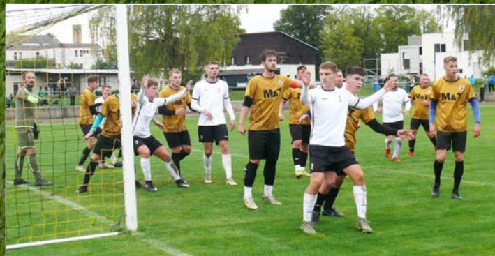
Solnice na domácí půdě porazila Dobrušku 4:0.