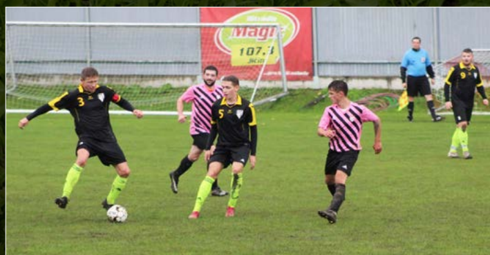
Fotbalisté Vysoké nad Labem získali postup do čtvrtfinále Poháru hejtmana v Kopidlně, kde vyhráli 5:2.