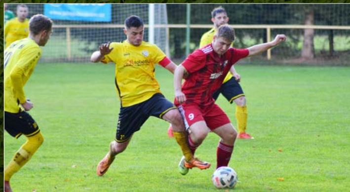
Dolní Kalná bojovala o další malý zázrak. A nebyla daleko. Doma nakonec těsně podlehla Libčanům 3:2.