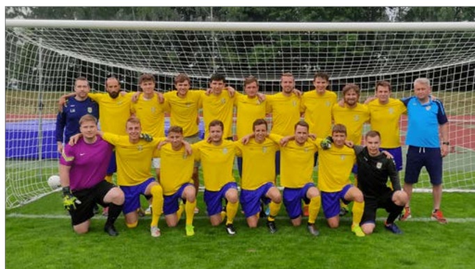
Tým Nového Města nad Metují je v tabulce na šestém místě.