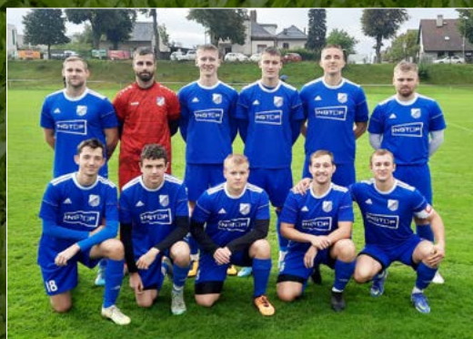
Nový Hradec Králové si doma poradil s Týništěm nad Orlicí a favoritovi uštědřil šestigólový debakl.