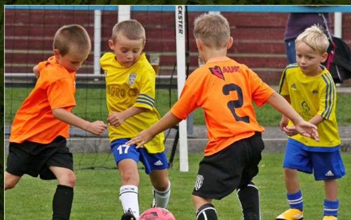
OP mladších přípravek. Na snímku utkání Česká Skalice

– Police nad Metují.