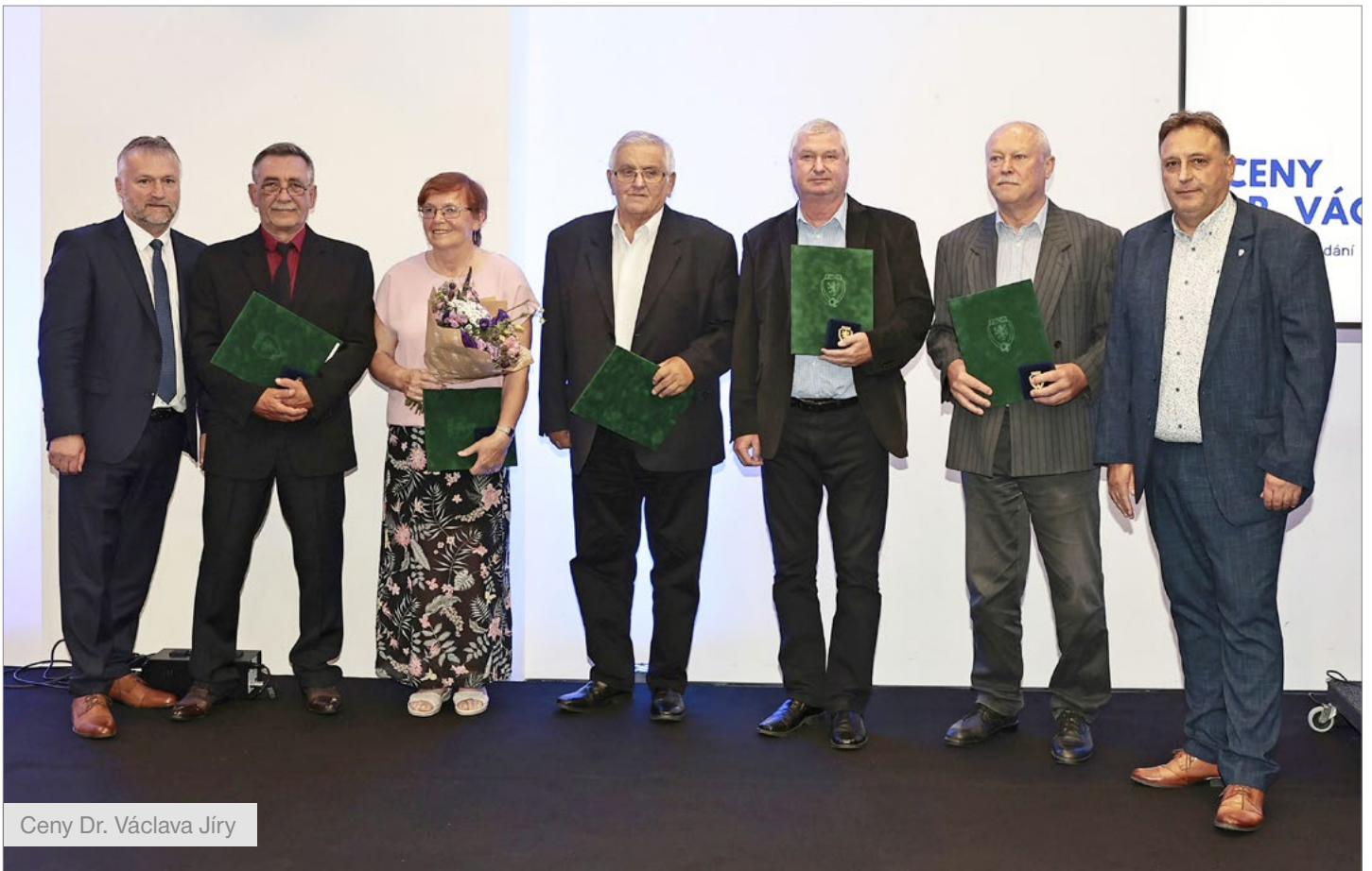
Ceny Dr. Václava Jíry