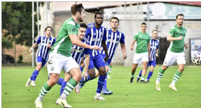
Fotbalisté Dvora Králové jsou tradičním účastníkem divize C. Na snímku utkání letošní sezony.

Majitel, pan Karadzós, fotbal dělá a celý platí už dvacet roků.