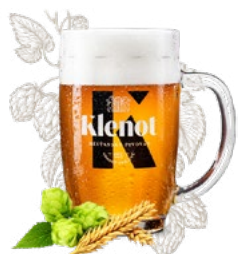
PIVO Z HRADCE KRÁLOVÉ

Pivo a fotbal k sobě neodmyslitelně patří.