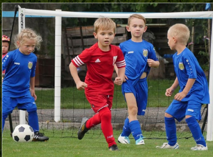
OP mladších přípravek. Duel Jaroměř – Nové Město n. M.