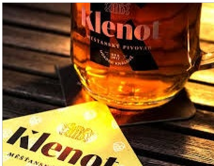
Klenot v Hradci vaří pivo už od roku 2017.