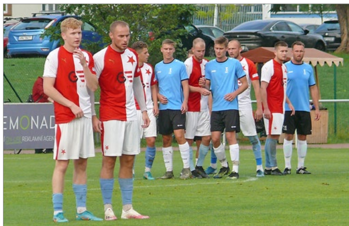
Solnice zvítězila na hřišti Slavie 4:1 a vede tabulku nejvyšší krajské ligy.

Na druhé straně samozřejmě panovalo zklamání. Hradecká Slavia ve šlágru kola výsledkově propadla, což mrzelo i zkušeného brankáře týmu Jiřího Maška. „Moc dobře se mi utkání nehodnotí.“