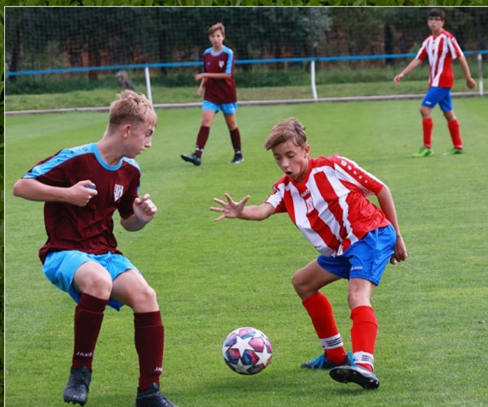
DAHASL Krajský přebor starších žáků U15 svedl dohromady i týmy Jaroměře a Vysoké n. L.+Nového HK.