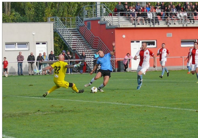
Po tomto souboji následoval pokutový kop Solnice.