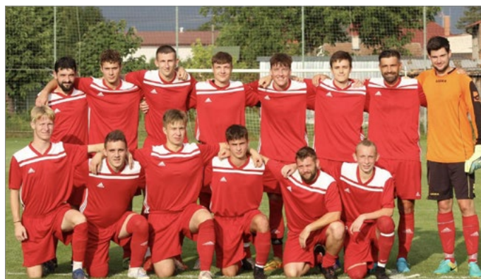
Fotbalisté Kopidlna v rámci pohárového utkání s hradeckou Třebší, které nakonec vyhráli 4:1.