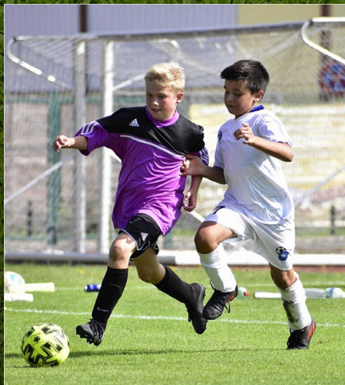
MEKKAGROUP Krajský přebor mladších žáků U13 ve Dvoře Králové.