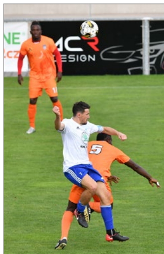
Vrchlábí se po zisku prvních bodů dostalo na čtrnácté místo.