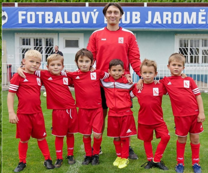
OP mladších přípravek v Jaroměři. Na snímku tým domácích.