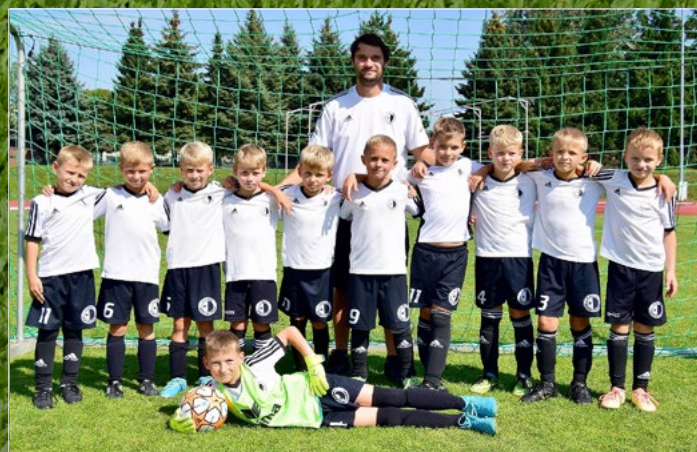
PLANEO CUP Pohár mládeže FAČR U9. Na snímku vítězný tým z Rychnova nad Kněžnou.