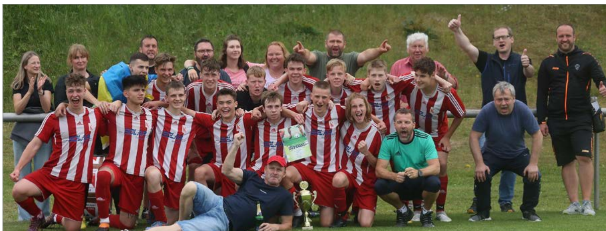
Starší dorost Jaroměře U19 po vítězství v krajském přeboru.