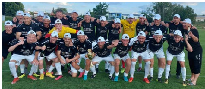
Fotbalisté Solnice ovládli krajský přebor. Divizi si však nakonec nezahrají.

Známi jsou i všichni sestupující. Přebor opouští trio Kostelec nad Orlicí, Vrchlabí a Vysoká nad Labem. Z 1. A třídy padají Náchod B, Sobotka a hradecká Lokomotiva. Celkem šest týmů sestupuje z I. B třídy. Ze skupiny A to jsou Kobylice, Dvůr Králové B a Rudník, z béčka pak Malšovice, Vamberk a Lípa nad Orlicí.