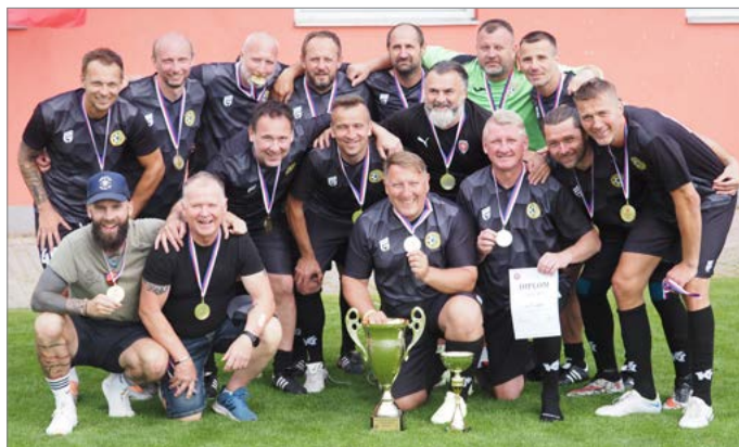
Vítěz MČR veteránů.