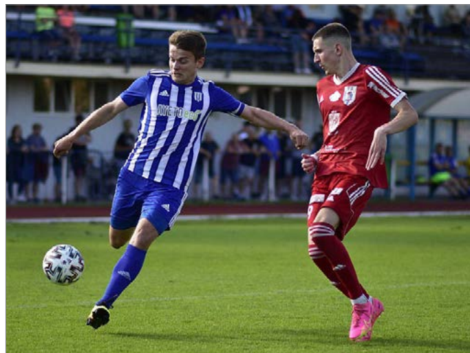
Fotbalisté Dvora Králové po 19 letech opouští divizi. Na snímku domácí duel s novobydžovskou Cidlinou.