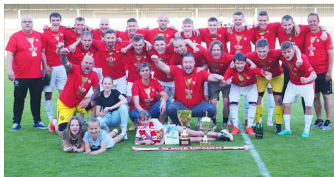
Fotbalisté Slavia Hradec Králové po zisku titulu v Poháru hejtmana na Královéhradeckého kraje.