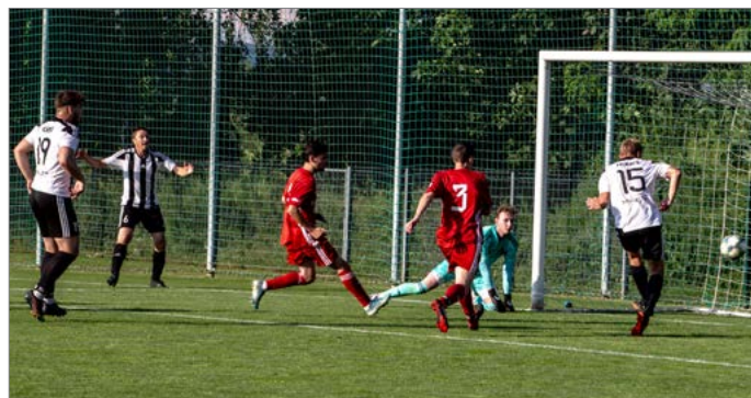
Gól! Hořice dávají branku na 3:2 v duelu s Rychnovem nad Kněžnou.