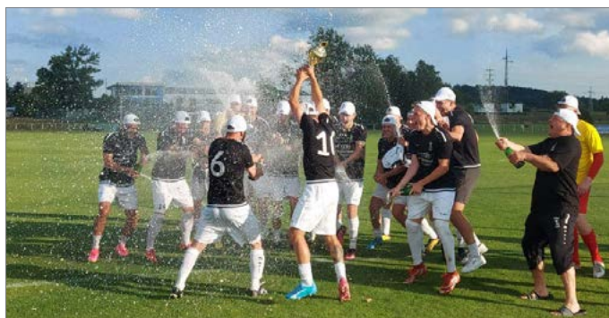
TABULKA - M GROUP CZ KRAJSKÝ PŘEBOR MUŽŮ 2022/2023