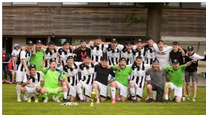
Vítěz 1. A třídy.