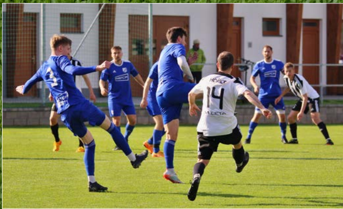
Hořice si na domácí půdě poradily s Týništěm nad Orlicí (3:1).