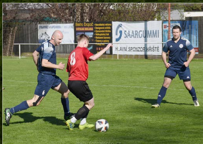
JAKO 1. B třída skupina B a duel Hronov – Opočno.