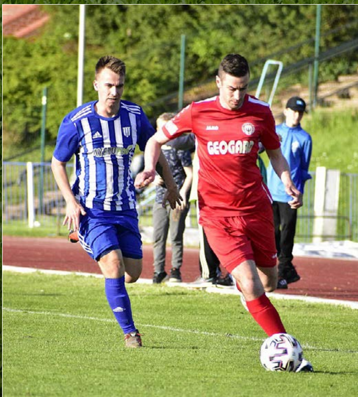
Ve Fortuna Divizi C porazil Dvůr Králové rezervu Chrudimí 3:1.