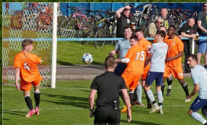
V M GROUP CZ Krajském přeboru remizovala Jaroměř s Policí nad Metují 0:0.