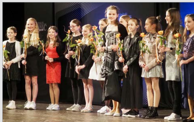
Mladší žákyně FC Hradec Králové, mistryně ČR za sezonu 2021/22.