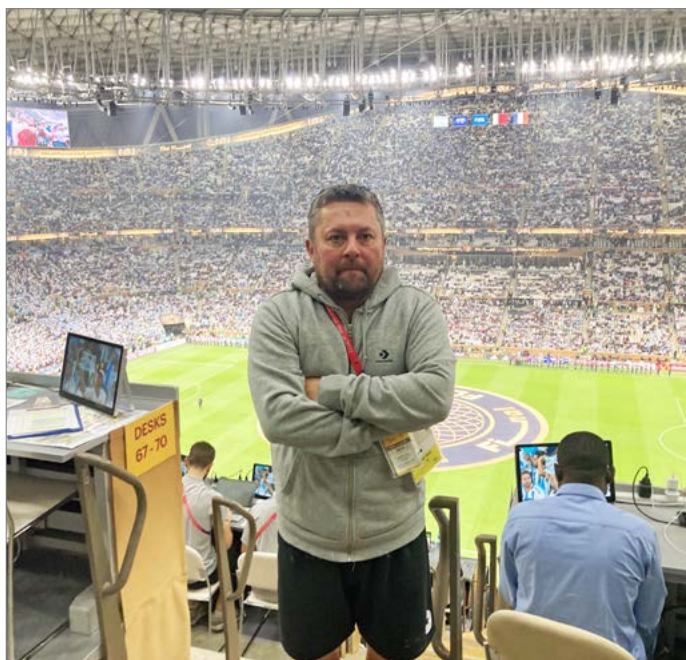
Zažil i finále mistrovství světa v Kataru.

„Když řeknu, že jsem hrál pražský přebor před dvaceti lety, tak mi všichni odpoví, že to je teď úroveň divize. Minimálně. Kvalita šla dolů, proto se teď dějí extrém, jako je Slavia, Solnice, kde platí v přeboru klukům dva tisíce a víc za zápas. Všechna čest majitelům, mecenášům, jenže tohle je cesta do pekla.“