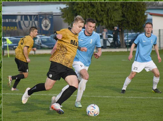
Dobruška v nejvyšší krajské lize remizovala se Solnicí 2:2.