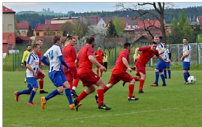
Fotbalisté Miletína na domácí půdě zdolali Náchod B 2:1.