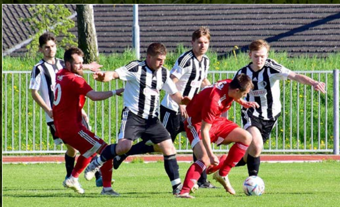
Rychnov nad Kn. – Libčany 0:1.